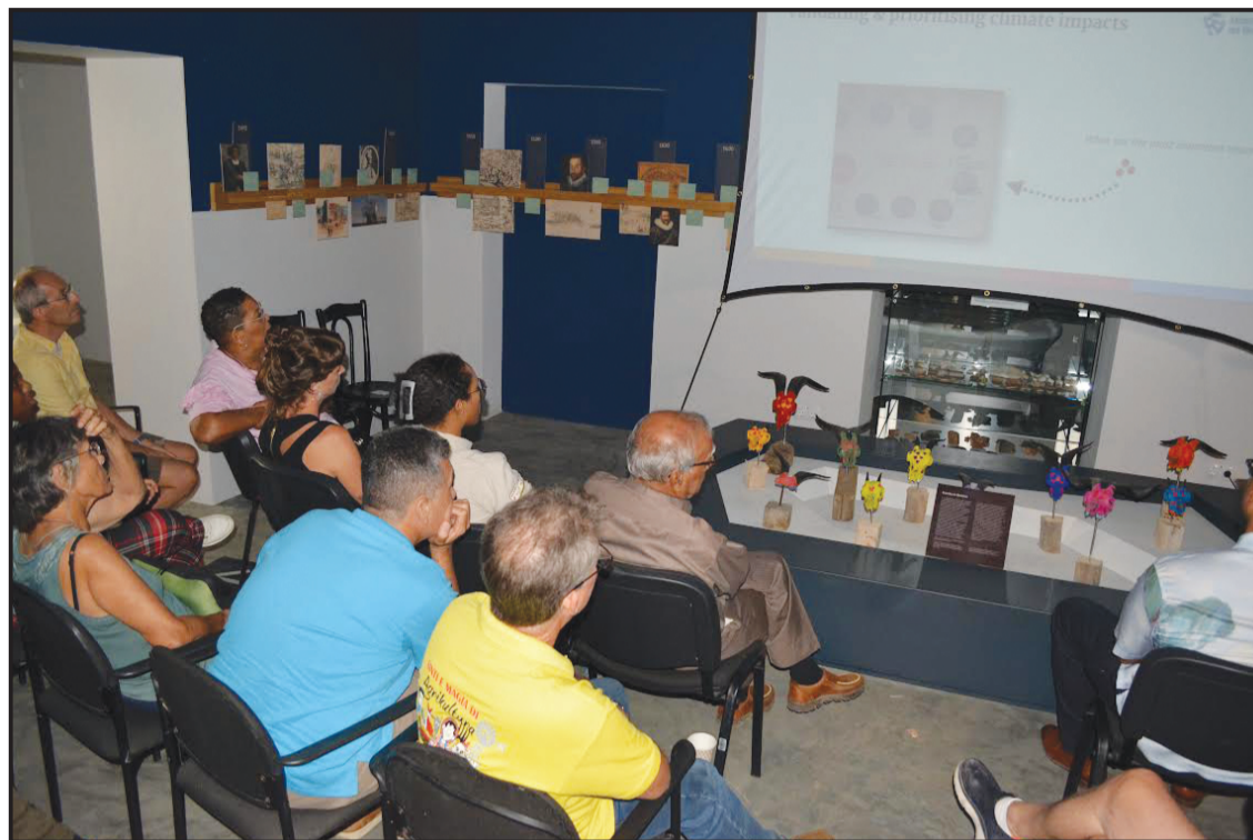
Filmá por parti na Boneiru

Banda di esei tin un Trans Atlantisch Platform (TAP) pa desaroyá kurso, lektura i workshop pa promové konosementu i konsientisashon tokante retonan di klima. Banda di esei, KNMI ta traha senarionan